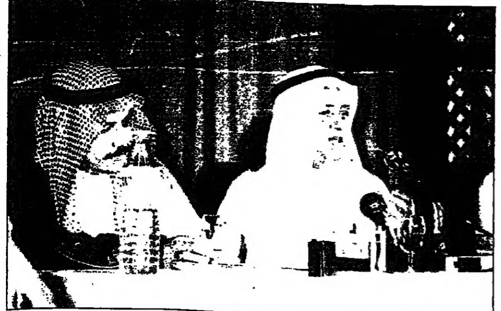
معالي وزير الحج والوقاف يجيب على أسئلة الصحفيين

ايران رفضت الحضور واضح معالي ان ايران رفضت حضور هذا المؤتمر بعد ان وجهت لها الدعوة لحضوره بحكم انها دولة عضو في منظمة المؤتمر الاسلامي . وقال انه مساء يوم السبت الماضي تلقينا برقية منهم عن طريق دبي يقرون فيها انهم ان يحضروا المؤتمر لانه يمثل علماء المسلمين . وتحقيقا على ذلك اكد معالي وزير الحج والوقاف ان المؤتمر لا يخص المملكة العربية السعودية وحدها بل هو مؤتمر اسلامي دعيت الى حضوره كافة الدول الاسلامية الاعضاء في منظمة المؤتمر الاسلامي . واصل تعليقه قائلا : نحن لم نسم المؤتمر باسم ايران بل باسمه مؤتمر وزراء الاوقاف والشؤون الاسلامية . ومن المنجول ان الذي كتب تلك البرقية وقعها هو وزير الارشاد والتوجيه الاسلامي في ايران الذي لم يكتبها بدون اذن مرجعه بل ولا يستطيع ان يقول ذلك دون موافقة مرجعه . واعرب عن امله ان يحقق المؤتمر النجاح المأمول له ويحقق الغاية التي يتوخاها العالم الاسلامي مشيرا الى اهمية ان يشعر المسلمون بتعلق هذه الاجتماعات ومنها بالتعاون الذي يبديه اصحاب المعالي ووزراء الاوقاف والشؤون الاسلامية . مشروعا من المملكة بقتان الشكيب واجابة على سؤال اوضح معالي